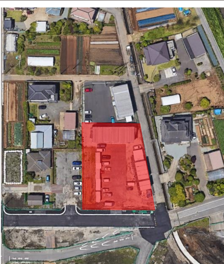
図面と現況が異なる場合は現況を優先させていただきます。