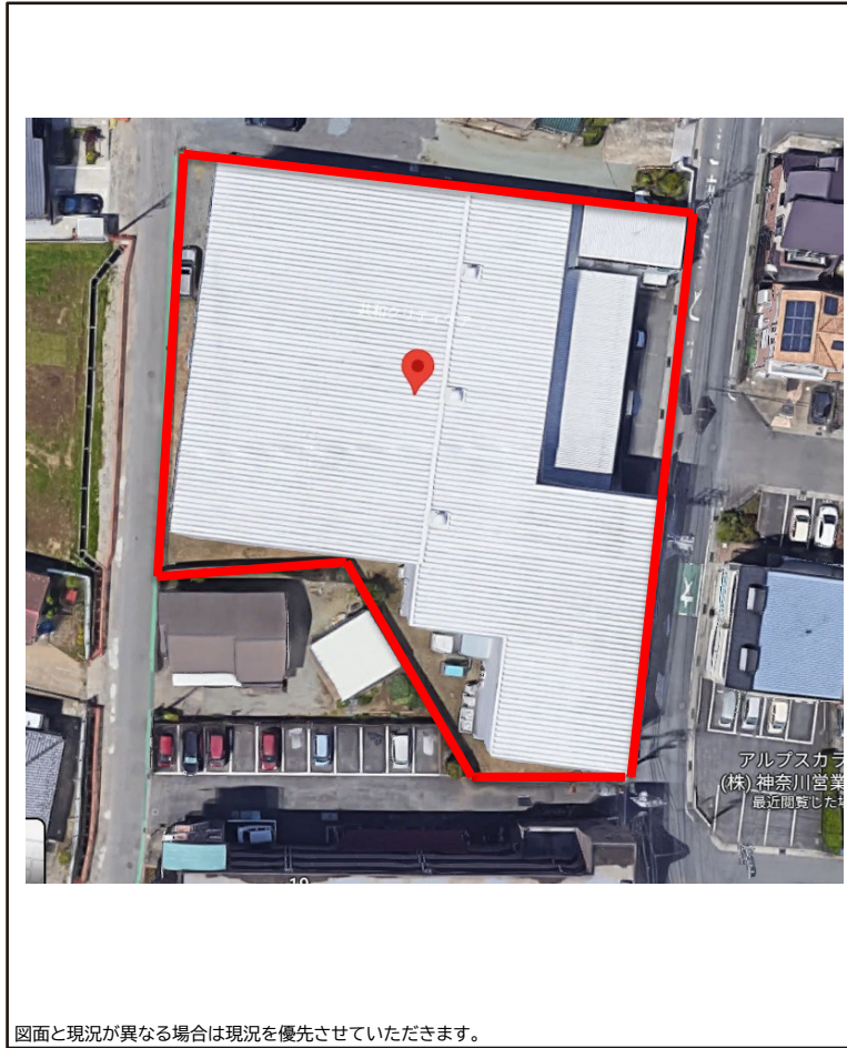
図面と現況が異なる場合は現況を優先させていただきます。